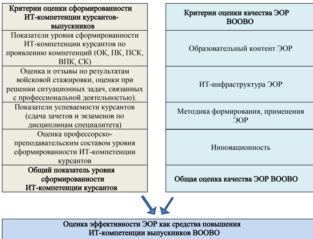
Схема оценки эффективности ЭОР как средства повышения ИТ-компетенции обучаемых в военном институте