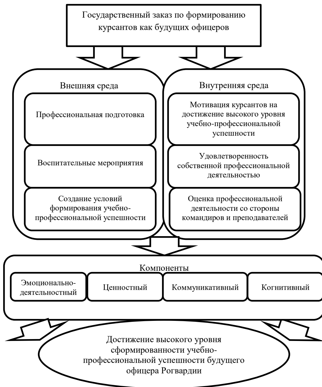
Рисунок 1 – Структура учебно-профессиональной успешности будущих офицеров Росгвардии

Элементы, отражающие содержание учебно-профессиональной успешности, выразились в ее структуре. Структура состоит из внешней и внутренней среды (Рисунок 1).