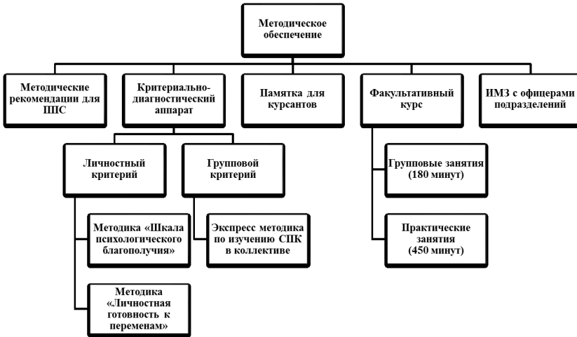
Рисунок 1 – Методическое обеспечение развития рефлексивной позиции устойчивости к информационным провокациям

Во второй главе исследования рассмотрены факторы, показывающие влияние информационных провокаций как общую проблему, которая может негативно повлиять на офицеров при выполнении служебно-боевых задач. В качестве решения предложены разработка и проведение методического обеспечения с будущими офицерами войск национальной гвардии. Уточнены определения: «информационная провокация» и представлена ее структура, «устойчивость к информационным провокациям», «рефлексивная позиция устойчивости к информационным провокациям», «методическое обеспечение» и представлена их структура.