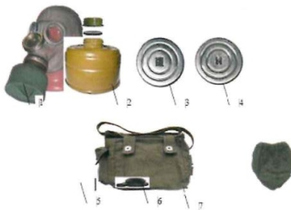
1 – шлем-маска ШМ-66; 2 – фильтрующе-поглощающая коробка ЕО-62К; 3 – не запотевающие пленки; 4 – мембраны переговорного устройства для ШМ-66; 5 – сумка; 6 – заглушка ФПК; 7 – чехол ФПК