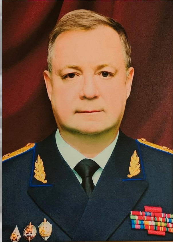
Председатель Счётной палаты с 2000 по 2013 генерал-полковник СТЕПАШИН Сергей Вадимович