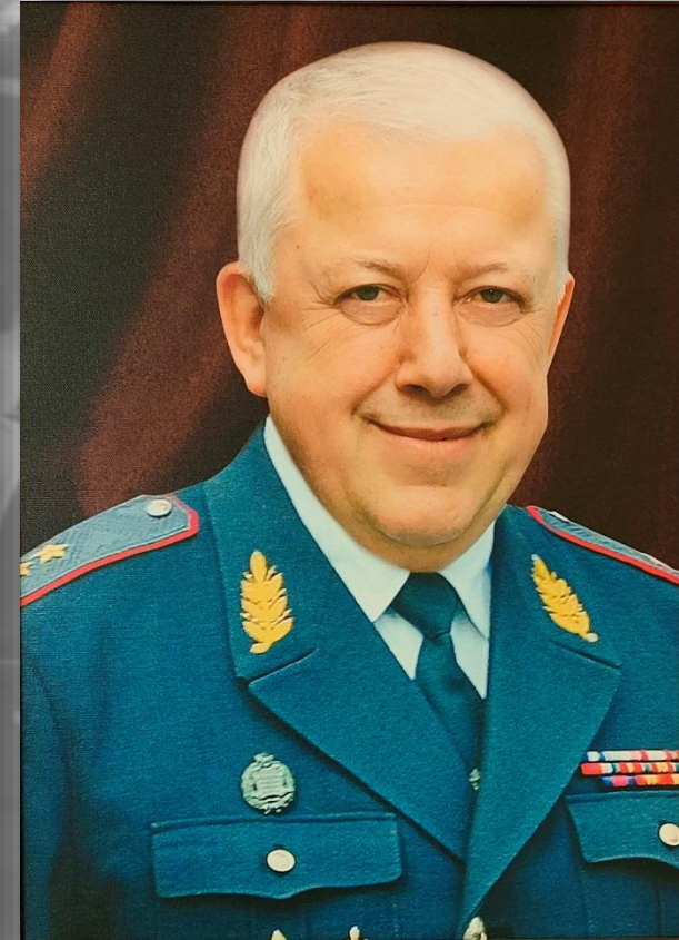
Начальник Управления администрации Президента Российской Федерации с 2012 по 2013 генерал-лейтенант милиции КИКОТЬ Владимир Яковлевич