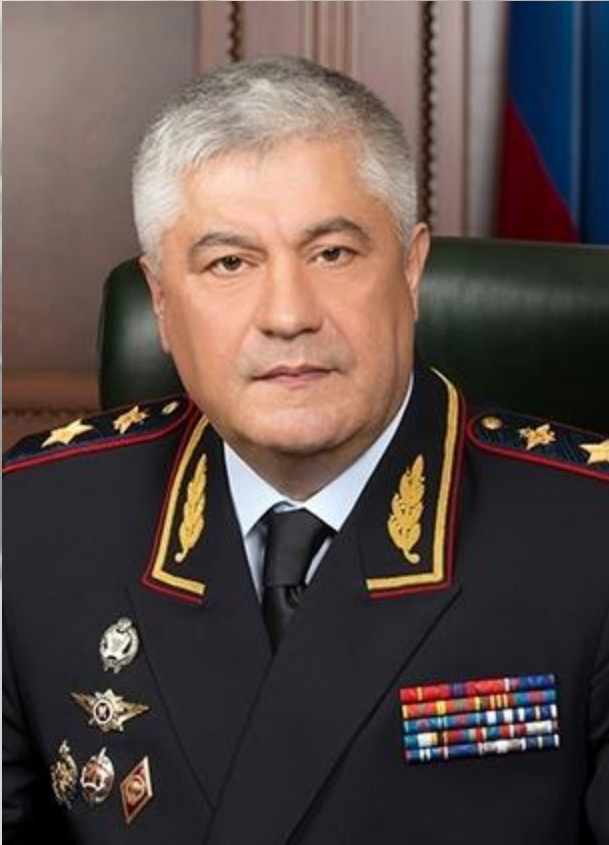
Министр внутренних дел Российской Федерации с 2012 по н.в. генерал полиции КОЛОКОЛЬЦЕВ Владимир Александрович