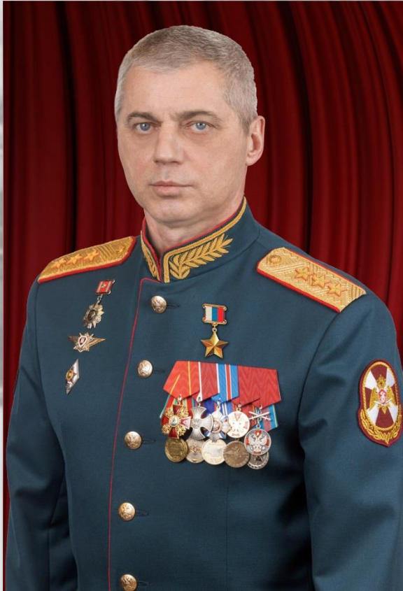
Начальник Главного штаба войск национальной гвардии Российской Федерации с 2023 по н.в. Герой Российской Федерации, генерал-полковник БОЙКО Сергей Михайлович